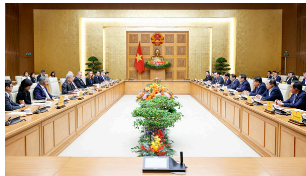
Lễ ký kết hợp tác giữa NVIDIA và Chính phủ Việt Nam

Việc ký kết hợp tác giữa NVIDIA và Chính phủ Việt Nam mang lại nhiều lợi ích quan trọng cho Việt Nam, bao gồm: Phát triển hạ tầng và công nghệ AI: Thành lập Trung tâm Nghiên cứu và Phát triển