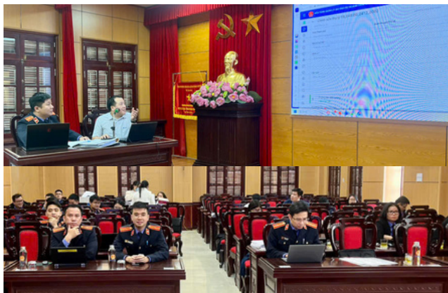
Triển khai kiểm thử Mô đun 1 - nền tảng QLAHS tại VKSND tỉnh Quảng Ninh

Thực trạng các phần mềm ứng dụng của ngành KSND nói chung và phần mềm phục vụ các khâu công tác trong lĩnh vực hình sự nói riêng được xây dựng chủ yếu để tổng hợp thông tin, tra cứu các thông tin, dữ liệu cơ bản về vụ án, bị can, bị cáo, người bị tạm giam, tạm giữ, thi hành án hình sự... nên chất lượng, hiệu lực, hiệu quả của việc ứng dụng các phần mềm này còn nhiều hạn chế và chưa đáp ứng được yêu cầu thực tiễn đặt ra ngày càng cao trong giai đoạn chuyển đổi số như hiện nay.